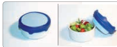
Der BLUEMAX Kühldeckel