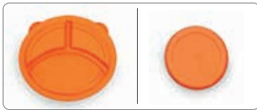
Die MONDO BASIC Deckel